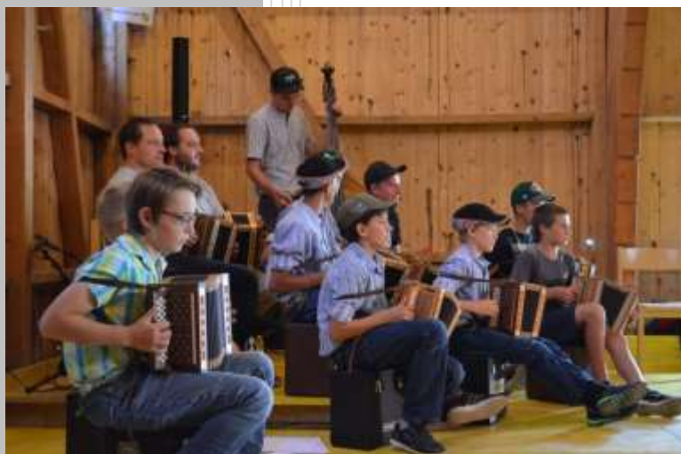
Grillfest in Calfreisen: Auftakt ins Jubiläumsjahr